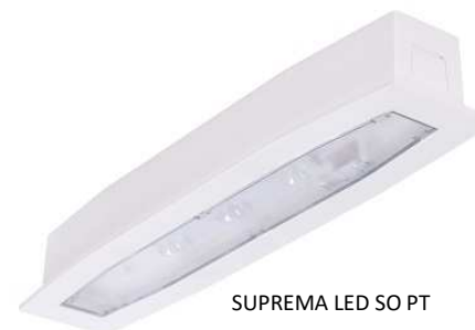
SUPREMA LED SO PT