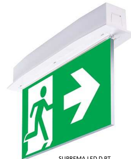
SUPREMA LED D PT