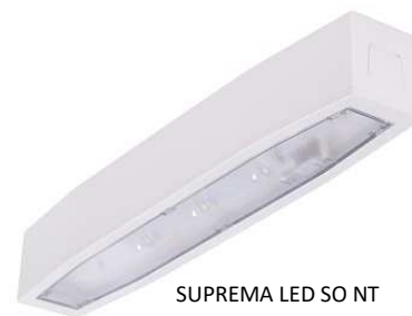
SUPREMA LED SO NT